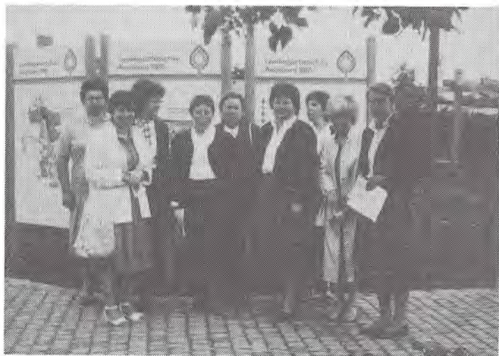
Unser Frauenkreis trifft sich regelmäßig zum Stricknachmittag und gemütlichem Beisammensein