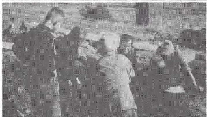
Die Hütte, das Herzstück unseres Vereinslebens damals wie heute!