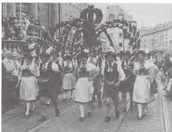
Die Plattlergruppe hat einen gut ausgelasteten Terminplan. Beim Kiliiani-Festzug repräsentiert sie den Bergbund. Seit 26 Jahren bringen wöchentliche Übungsstunden das nötige Können. Zur Zeit pflegen 16 Paare die Plattel-Tradition